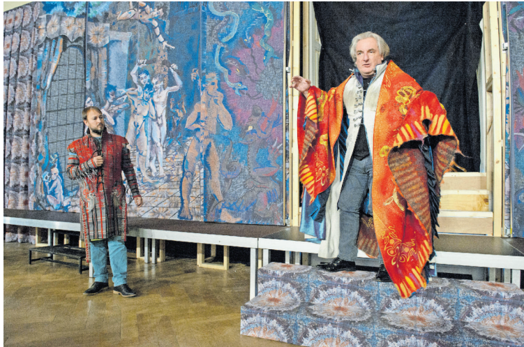
Opernszenierungen können auch Jugendliche begeistern. Diese sollen Aufführungen wie «Bianca e Fernando» von Vincenzo Bellini zu vergünstigten Preisen geniessen können.

Mit dem symbolischen Beitrag von einem Franken pro Monat werden Club-Giuven-Mitglieder zu ermäßigten Preisen Aufführungen der Opera Engiadina besuchen und kostenlos die An-